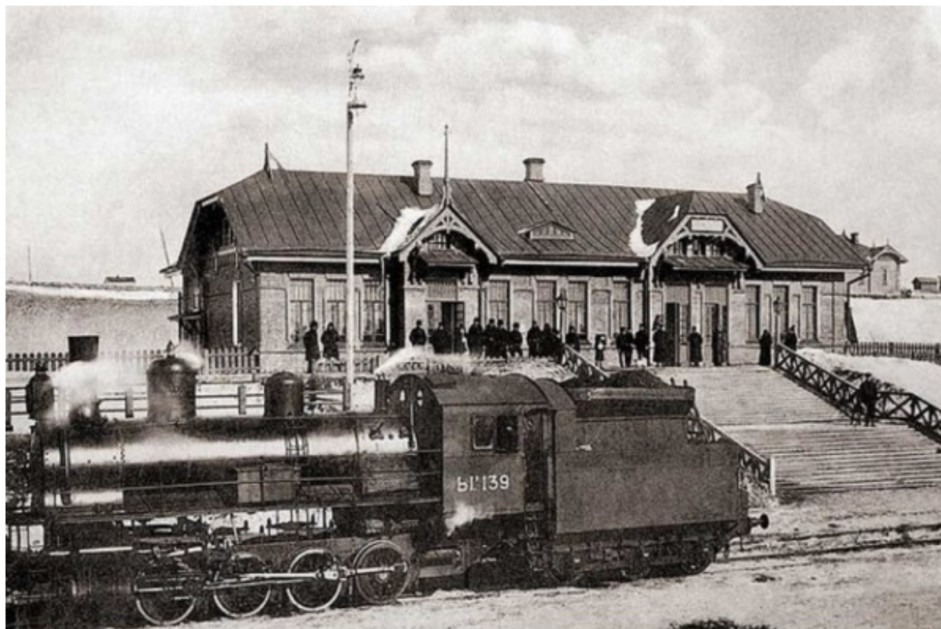
Вокзал станции "Ново-Николаевск.Алтайская". (Фото 1913-17 гг.) Вокзал на станции "Ново-Николаевск.Алтайская" ("Новосибирск-Южный") был построен в 1913 г. Это первое полностью сделанное из камня пассажирское здание города