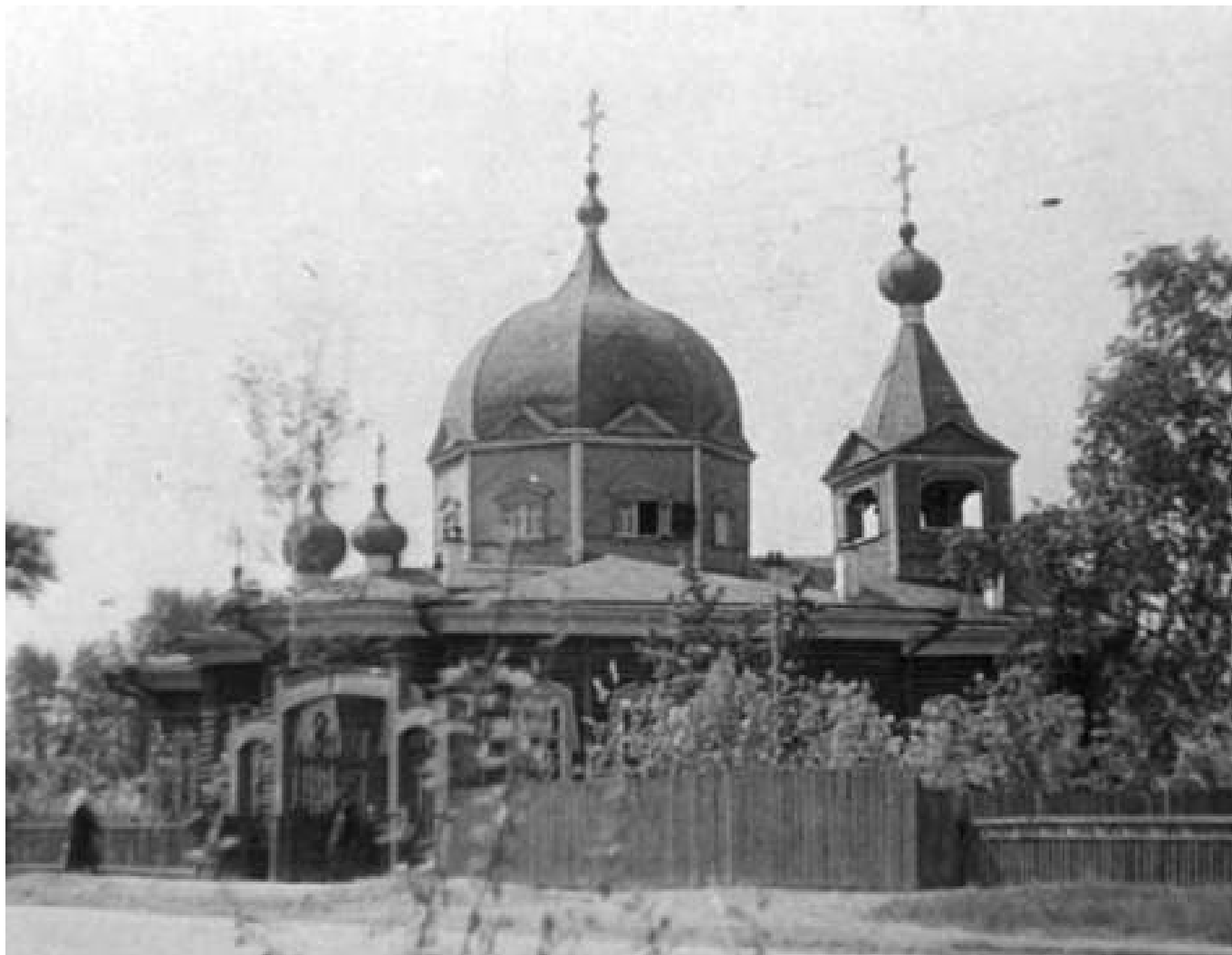
Вознесенский кафедральный собор до реконструкции

Увы, к 1971 году дореволюционная церковь обветшала, а тут ещё и новый цирк её унизил, отобрал один из двух входов на её территорию. Городские власти могли бы построить стеклянное сооружение, увенчанное офицерской фуражкой, там, где цирковой шатёр стоял прежде – на Андреевской площади; могли поставить его на месте шапито за «Коброй». Но выбрали площадку рядом с многотерпеливым собором. Немногочисленные в то время верующие новосибирцы восприняли это решение как акт глумления. Именно тогда они начали реконструкцию кафедральной церкви, которую завершили к 1000-летию Крещения Руси. Собор сильно похорошел, однако сделать его выше и просторнее городские власти не позволили.