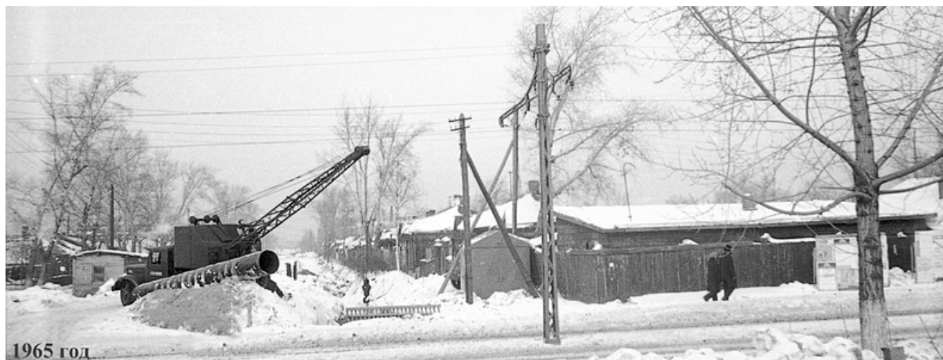
Так выглядело место, где вскоре появится здание цирка, в 1965 году

В шестидесятые годы за дело взялись всерьёз. Один за другим возводили кинотеатры и дворцы культуры. В 1962 году распахнули двери «Космос» и «Москва». В 1969 открылась «Аврора». В 1970 году сдали в эксплуатацию новое здание кинотеатра имени Маяковского. Тогда же был построен Дворец культуры завода имени Чкалова. Вскоре – «Строитель».