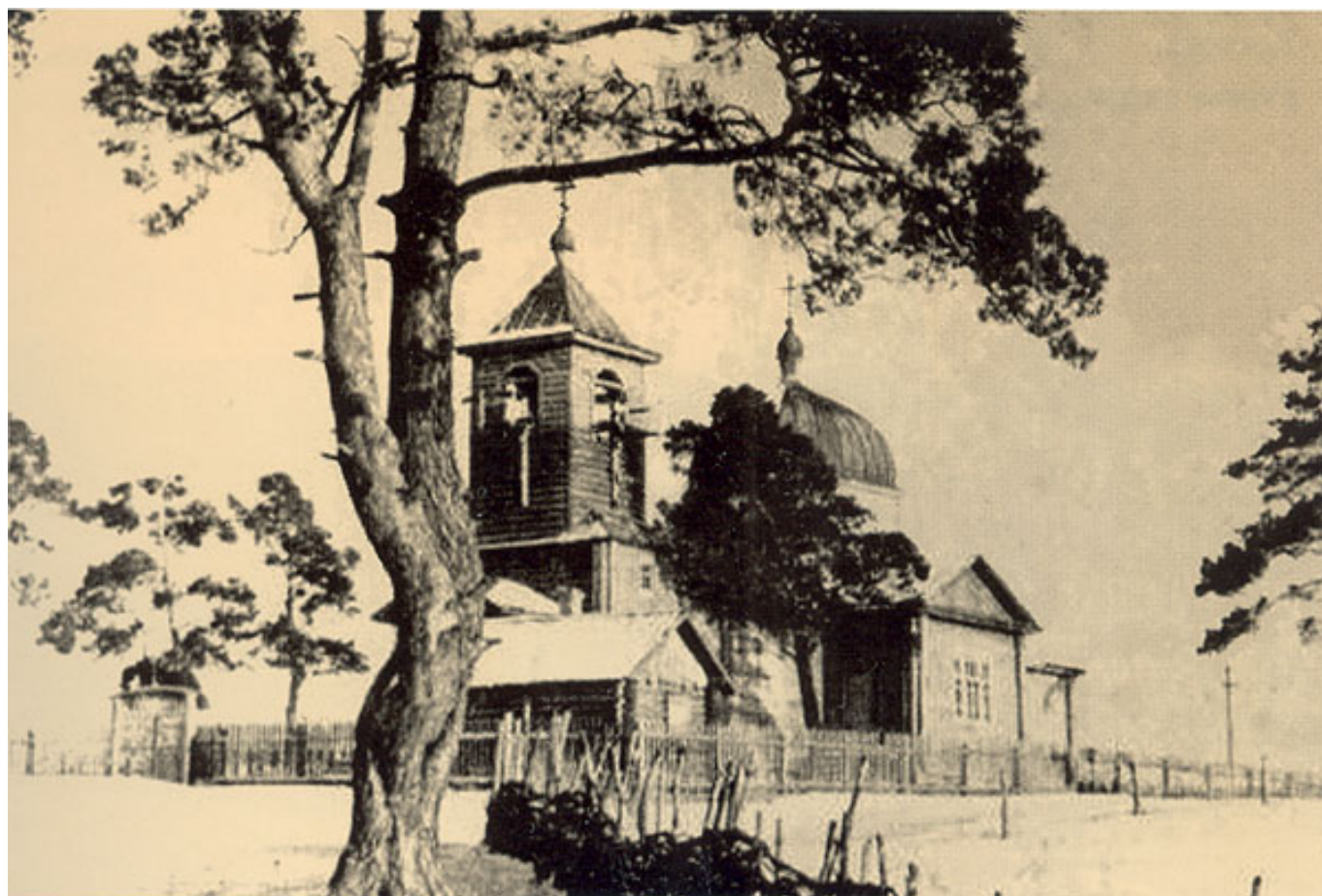
Вознесенская церковь до революции

гиперболического параболоида, похожие на контуры воинственной офицерской фуражки. И это неподалёку от дряхлого купола деревянной православной церкви, которой жилось в ту пору отнюдь не сладко!