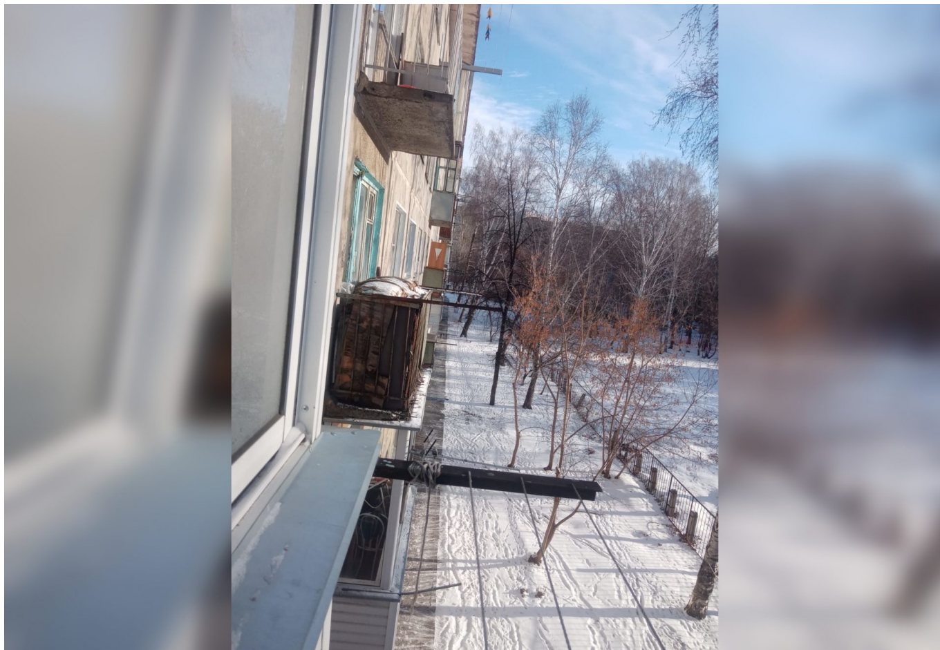
Балкон доверху завален всяким хламом.