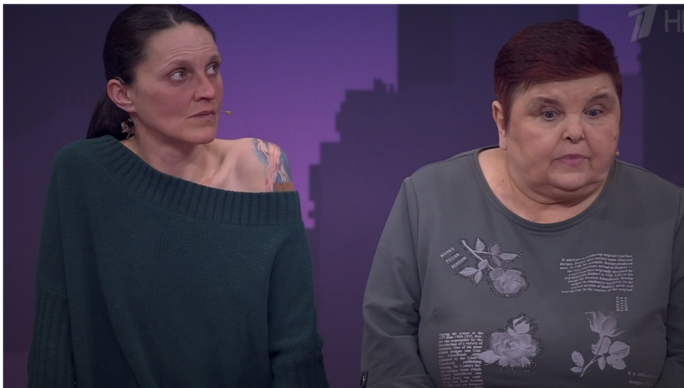
Фрагмент программы «Мужское/Женское» от 06.06.2025