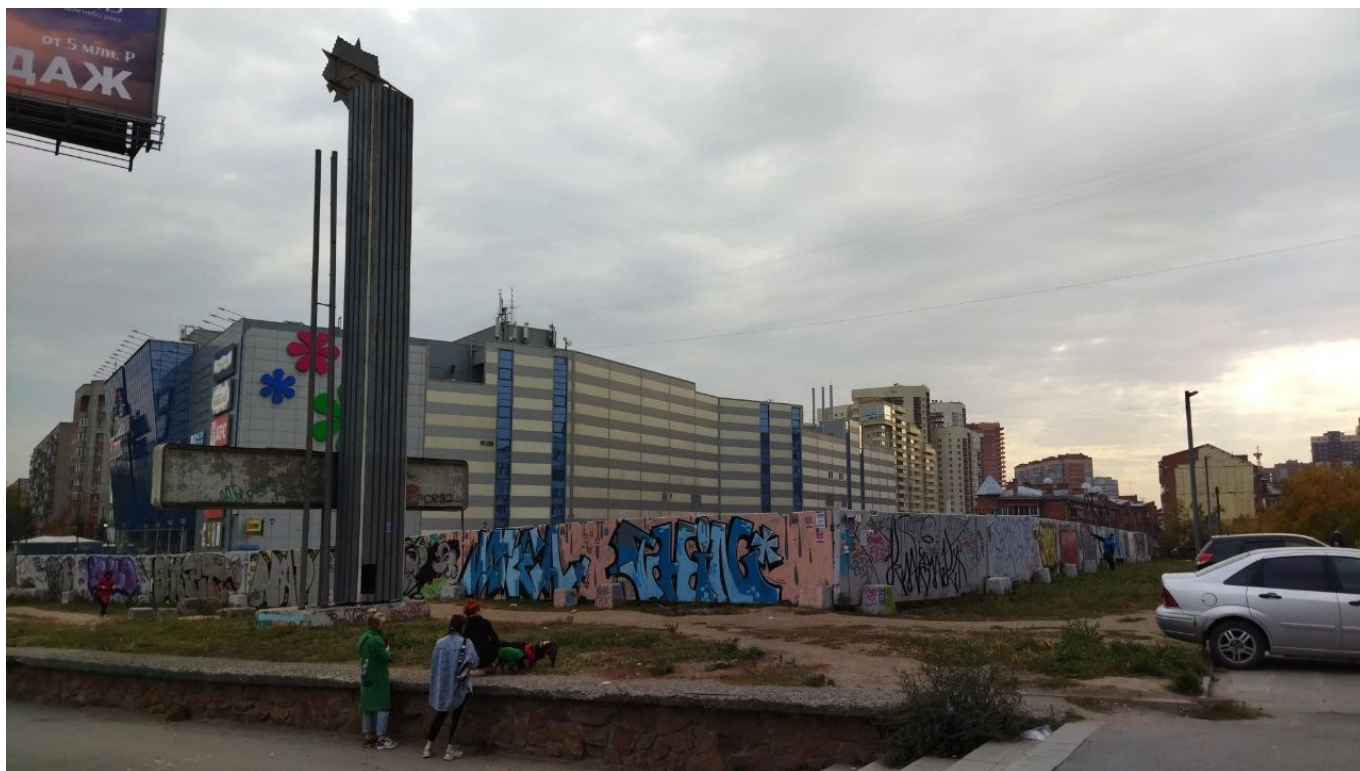
Вид на стелу, ТРЦ и участок для застройки в сентябре 2022 года.

Тем временем правоохранительные и надзорные органы выявили по итогам проверок ряд нарушений. Прокуратура установила , что за содержанием и сохранностью стелы никто из чиновников не следил, а по документам она и вовсе отсутствовала.