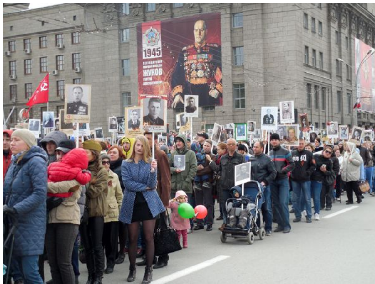
Шествие «Бессмертный полк» 9 мая 2016 г. Новосибирск

Авторы законопроекта предлагают не оставлять безнаказанными «публичные действия, выражающие явное неуважение к обществу и совершенные в целях оскорбления чувств ветеранов Великой Отечественной войны путем умышленного искажения информации», а также для того, чтобы «уничтожить или умалить подвиг военнослужащих вооруженных сил СССР».