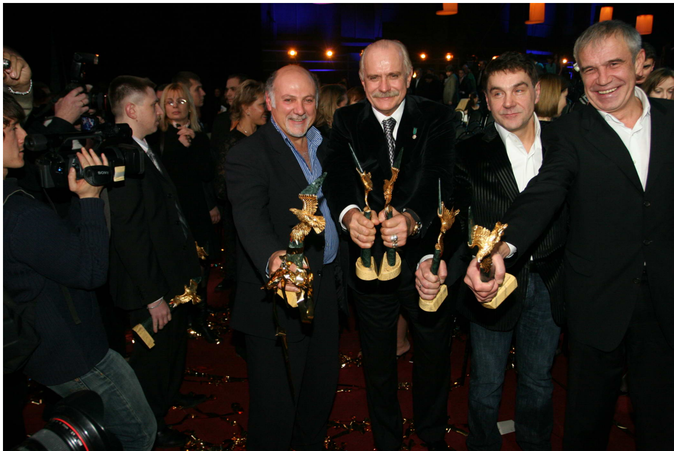
Сергей Газаров, Никита Михалков, Сергей Маковецкий, Сергей Гармаш