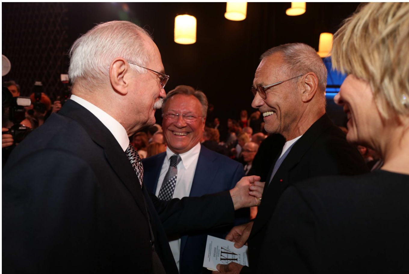
Никита Михалков, Сергей Шакуров, Андрей Кончаловский, Юлия Высоцкая